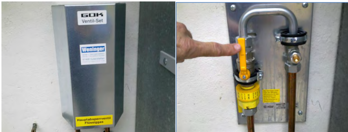
Hauptsperventil nur in Notfällen betätigen, sonst nie!!

SANO-GAS-Vertrieb Helmut Kirch Hauptstraße 29 97355 Wiesenbronn Tel: 09325 280 Mobil: 0171 539 82 14